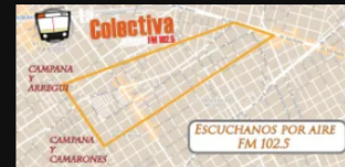
Escuchanos por Aire